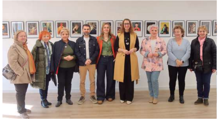
Clausura de la exposición de pintura 'Mujeres leyendo'