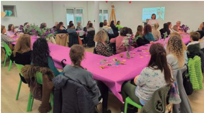
Taller de Salud Mental 'Florecer desde dentro'