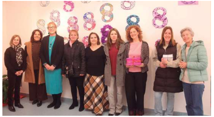
Exposición 'Castellanomanchegas transformando el mundo'