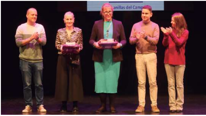
Acto institucional con el concurso escolar