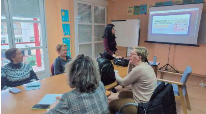
Taller sobre redes sociales para mayores del Centro de la Mujer