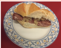
Ciervo a la plancha con cebolla frita