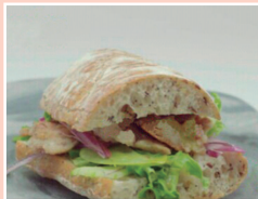
Ibérico y su arte flamenco