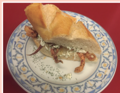
Rejos a la andaluza con alioli