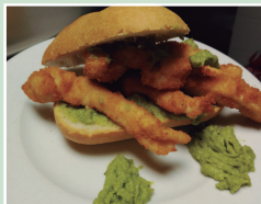
Fingers de pollo con salsa de aguacate casera