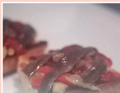
Escalivada con anchoas