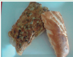
Tortilla de boletus y trigueros