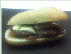
Escalopín de ternera sobre cama de cebolla confitada y tapa de Brie