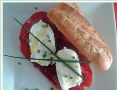
Cecina con mozzarella de búfala