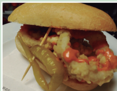
Calamares a la andaluza con salsa de la casa picante