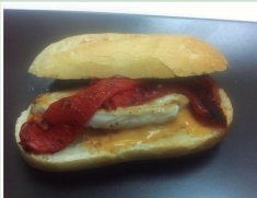
Pollo a la plancha con pimiento rojo asado y salsa de queso cheddar